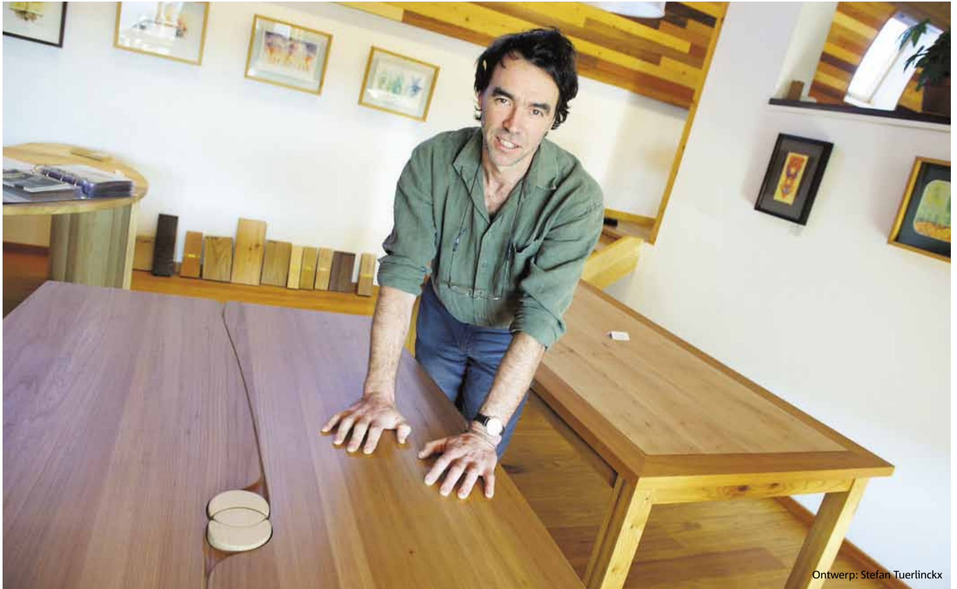
Ontwerp: Stefan Tuerlinckx