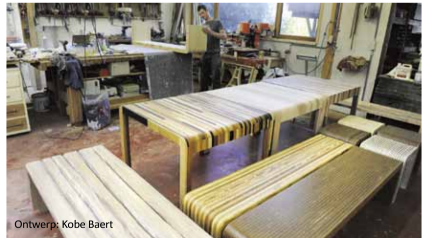
Ontwerp: Kobe Baert